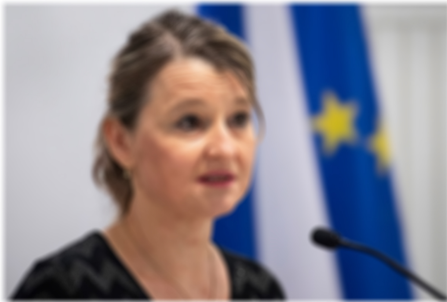
Die Verhandlungen mit der Europäischen Union über die Handelsabkommen sind im Dezember 2019 im Stau. Die EU droht die Verhandlungen zu beenden, wenn die Schweiz nicht bald einen Weg gefunden hat, um die Streitigkeiten zu lösen.

Die Verhandlungen mit der Europäischen Union über die Handelsabkommen sind im Dezember 2019 im Stau. Die EU droht die Verhandlungen zu beenden, wenn die Schweiz nicht bald einen Weg gefunden hat, um die Streitigkeiten zu lösen. Die Verhandlungen sind im Dezember 2019 im Stau. Die EU droht die Verhandlungen zu beenden, wenn die Schweiz nicht bald einen Weg gefunden hat, um die Streitigkeiten zu lösen.