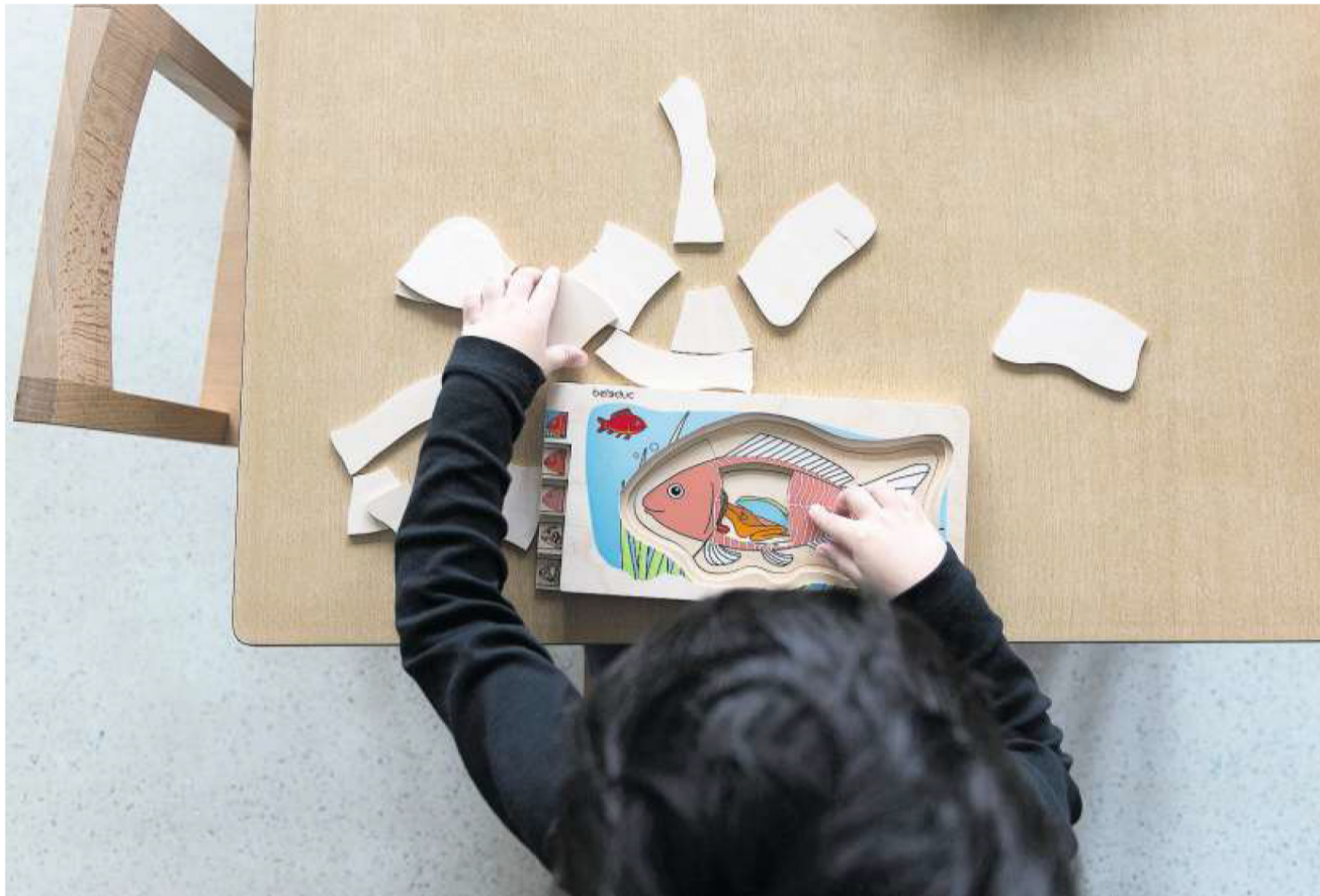
Krippen spielen eine zentrale Rolle bei der Vereinbarkeit von Familie und Beruf.

Im Kanton Zürich haben SP, Grüne, GLP, EVP und AL jüngst einen Vorstoss eingereicht. Doch die Stadt Zürich