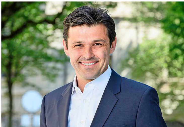
Matthias Aebischer wurde von vielen Grünen gewählt.

Das Spitzenergebnis für Rytz bedeutet, dass sie im Durchschnitt von etwa jeder siebten Liste, die nicht für die Grünen abgegeben wurde, eine Panaschierstimme erhalten hat. Im Wissen um die grosse politische Nähe zwischen SP und Grünen erstaunt wenig, dass Rytz ihr hervorragendes Resultat vor allem der SP verdankt, 26 Prozent ihrer Panaschierstimmen stammen von der SP-Frauenliste, und die Stimmen aller vier SP-Listen machen fast 40 Prozent ihrer total 45 343 Panaschierstimmen aus.