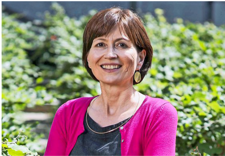
Regula Rytz erhielt viel Support von SP-Wählern.

Der Wahlsieg der Grünen manifestiert sich auch in der Rangliste der populärsten Kandidierenden im Kanton Bern: Regula Rytz, Präsidentin der Grünen, belegt mit 151 Panaschierstimmen pro 1000 Listen klar Rang 1, Jürg Grossen, Präsident der Grünliberalen, mit 93 Stimmen Rang 5. Dazwischen liegen Christa Markwalder (FDP, 114), Matthias Aebischer (SP-Männer, 109) und Nadine Masshardt (SP-Frauen, 95). Der Freisinnige Christian Wasserfallen, der vor vier Jahren noch den ersten Platz belegt hat, folgt mit 92 Stimmen auf Rang 6.