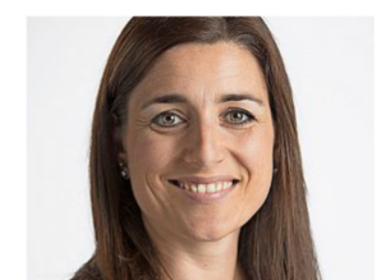
Flavia Wasserfallen war sechs Jahre lang Co-Generalsekretärin.

Levrat will sich zu seinen Plänen nicht äussern. Im Moment fokussiert die Partei auf die zweiten Wahlgänge für den Ständerat. In den nächsten Tagen und Wochen werde die Leitung das Wahlergebnis analysieren und «selbstkritisch hinterfragen», schreibt er in einer schriftlichen Stellungnahme. Dabei werde man nicht nur über Inhalte und die Wahlkampagne reden – sondern auch über personelle Fragen. «Das war immer so geplant, unabhängig vom Wahlergebnis», sagt Christian Levrat, offensichtlich bemüht, seinen absehbaren Rücktritt nicht als Folge der krachenden Wahlniederlage erscheinen zu lassen.