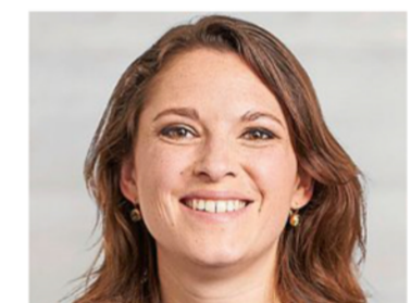
Mattea Meyer ist Nationalrätin aus Winterthur.