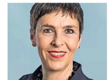
Barbara Gysi, Vizepräsidentin der SP.