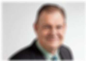
Portrait of the man mentioned in the article.

Der CVP-Nationalrat wollte mit seinen Nordkorea-Tweets das Vertrauen des Regimes gewinnen. Der CVP-Nationalrat wollte mit seinen Nordkorea-Tweets das Vertrauen des Regimes gewinnen. Der CVP-Nationalrat wollte mit seinen Nordkorea-Tweets das Vertrauen des Regimes gewinnen.