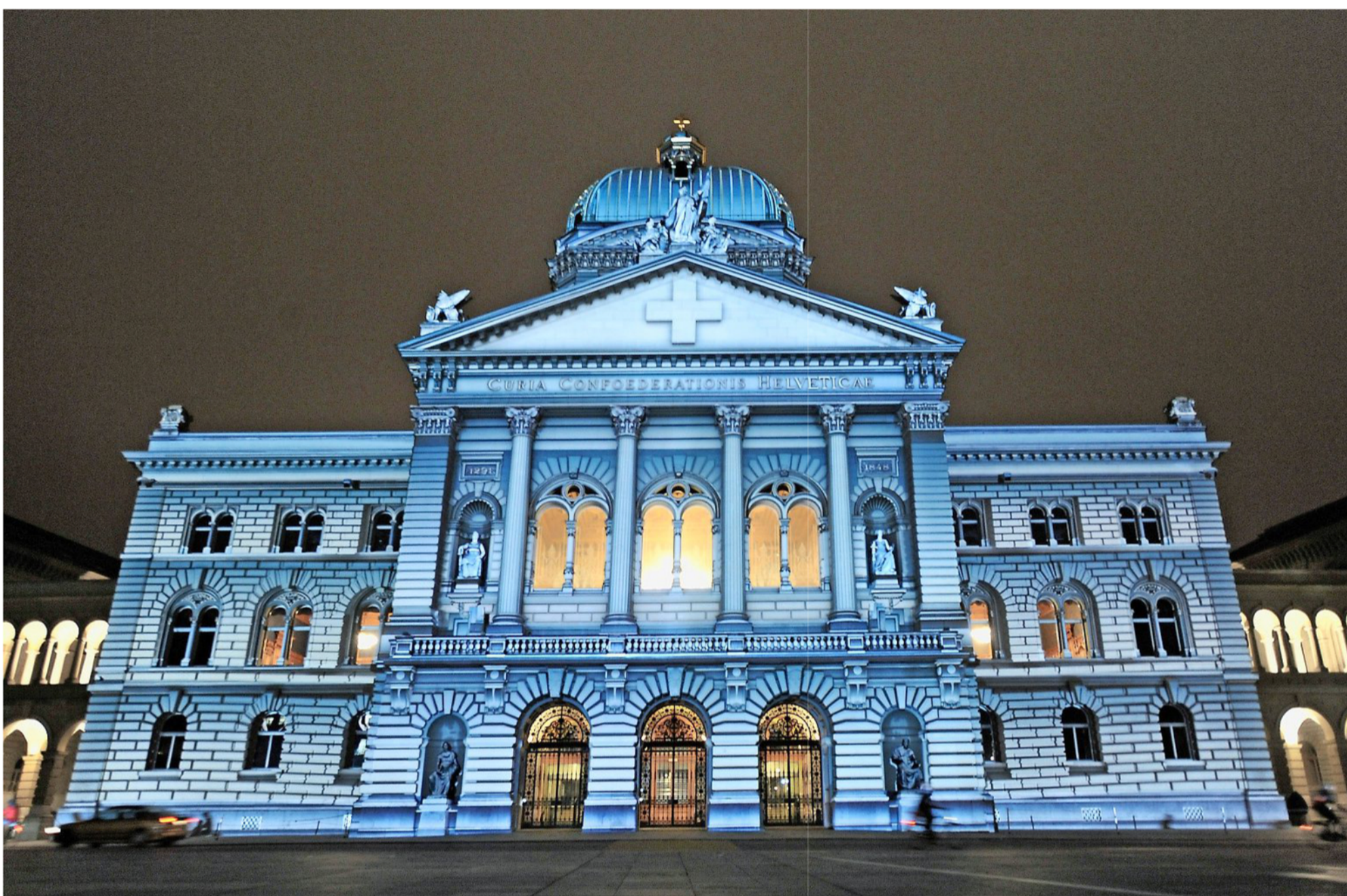
Am 20. Oktober bei den Wahlen im Scheinwerferlicht: das Bundeshaus in Bern. 651 Bernerinnen und Berner wollen dort einen Nationalratssitz erobern.

Bei der Ausmarchung um die Restmandate spielen Listenver-