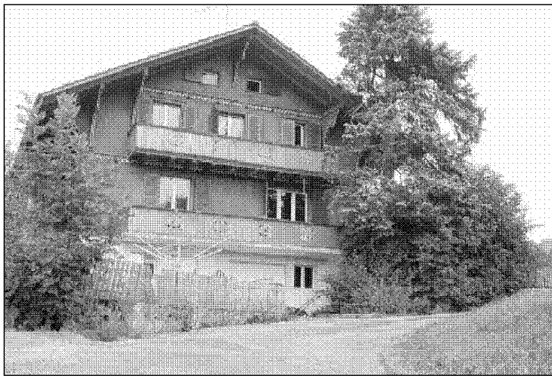
Trügerisches Idyll In diesem Chalet bei Huttwil rastete ein Familienvater aus und bedrohte Frau und Tochter.

Erst die Eliteinheit Enzian der Kantonspolizei Bern bringt die Situation unter Kontrolle. «Enzian» muss dort intervenieren, wo ein erhöhtes Risiko für die ordentlichen Polizeikräfte besteht. So steht es auf der Internetseite der Kantonspolizei Bern. «Enzian» kommt bei Geiselnahmen, Anhaltung