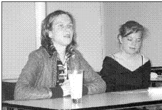
Helferin Nationalrätin Evi Allemann zeigt der SP Langenthal, wie man einen erfolgreichen Wahlkampf führen kann.

Nach Kaffee und Gipfeli erzählte die 25-jährige Berner SP-Nationalrätin Evi Allemann von ihrem Wahlkampf für die Nationalratswahlen, die im letzten